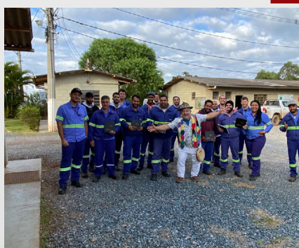
Lançamento Livro 20 anos Jaguar Unidade CPA