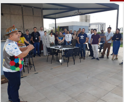
Lançamento Livro 20 anos Jaguar Matriz