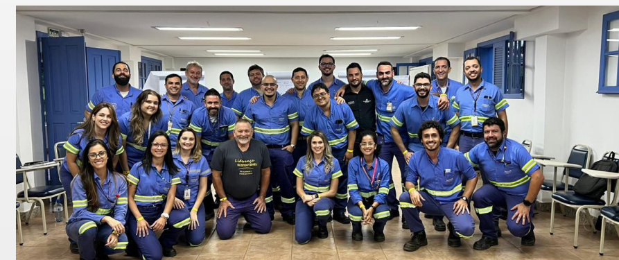
Mina Criativa reuniu pessoas de diferentes formações e habilidades