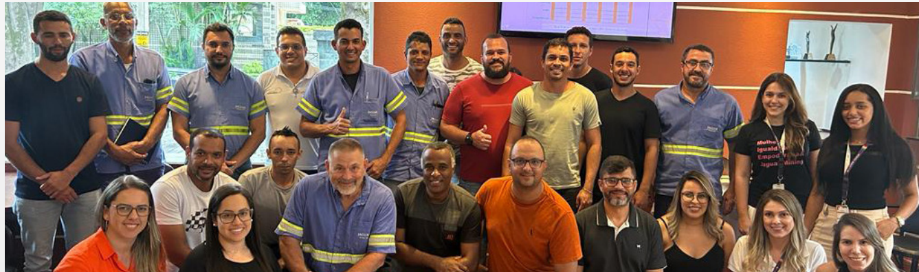
Lideranças da Jaguar