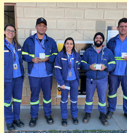
DDS na Unidade CPA

conscientização sobre a auditoria interna, foi enfatizado o papel do empregado no cumprimento das políticas e dos procedimentos para o fortalecimento da estrutura de controle interno da empresa. “Isso envolve a documentação adequada das atividades, o reporte de irregularidades ou suspeitas de fraude, a colaboração junto aos colegas de trabalho e o cumprimento de prazos”, esclarece. A campanha envolveu todos os empregados próprios e terceiros da Jaguar.