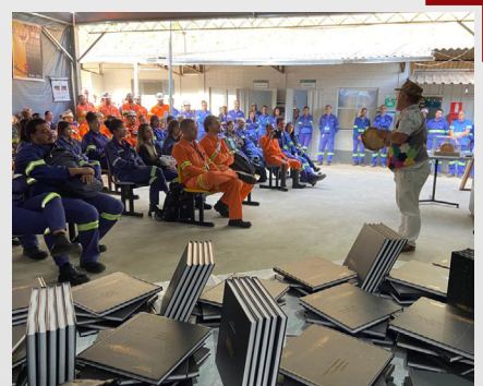
Lançamento Livro 20 anos Jaguar Unidade Pilar