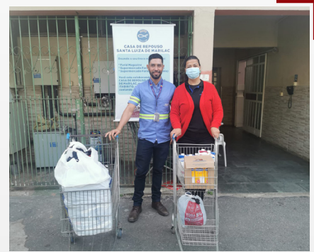
Voluntariar Agasalhar e Ecosustentável Doações da Unidade CPA