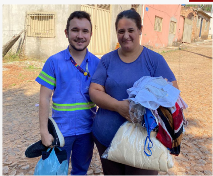
Voluntariar Agasalhar Doações da Unidade MTL