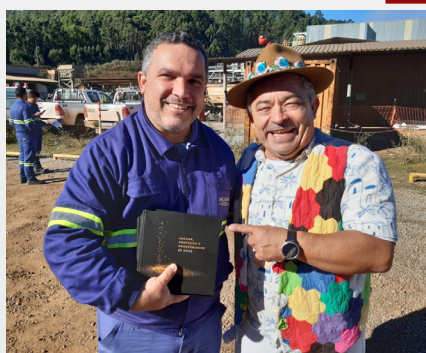
Lançamento Livro 20 anos Jaguar Unidade RG