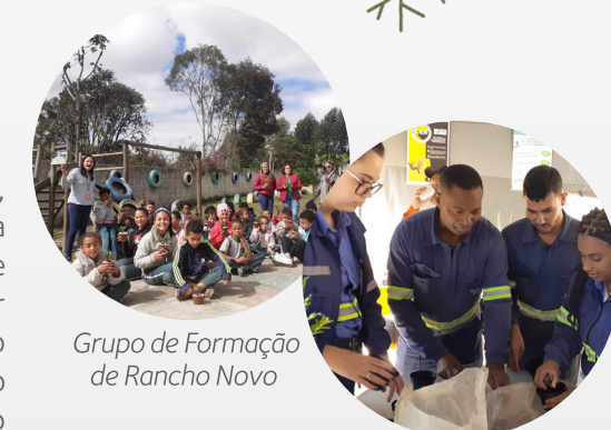
Grupo de Formação de Rancho Novo