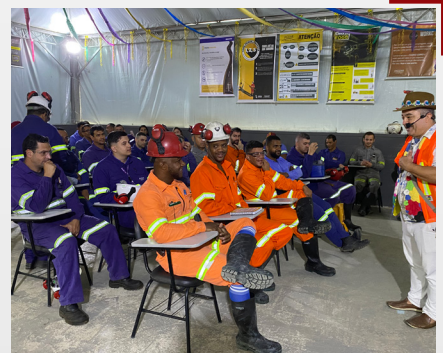
Lançamento Livro 20 anos Jaguar Unidade MTL