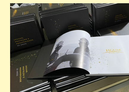
Referência para a história do ouro em Minas