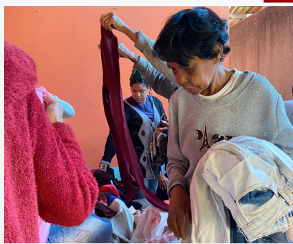
Voluntariar Agasalhar Doações da Unidade RG