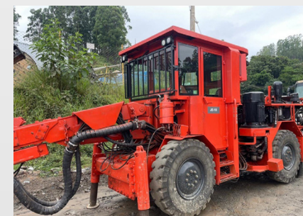
Jumbo ganha nova cabine

Uma reforma deixou mais seguro e eficiente um dos equipamentos de perfuração usados na Unidade Pilar. Um Jumbo teve sua cabine modificada, passando a ser inteiriça, o que garante mais segurança ao operador, além de melhor vedação para o sistema de ar-condicionado. Também foi instalada grade no para-brisa, ampliando a proteção.