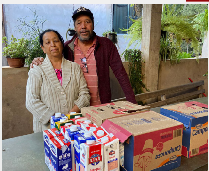
Voluntariar Ecosustentável Doações da Unidade Pilar