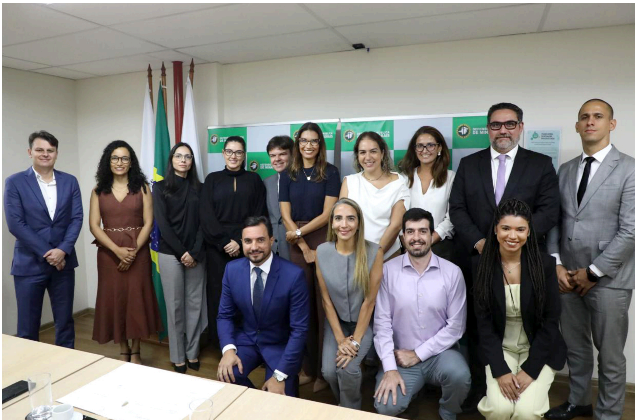
Representantes da Defensoria Pública e da Jaguar Mining