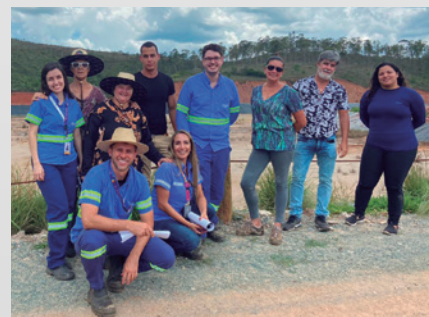
Empregados da Jaguar recebem integrantes da CBH Rio das Velhas