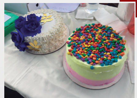
Produtos das alunas de Brumal