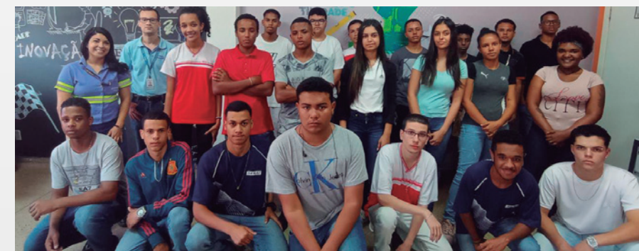
Turma de aprendizes