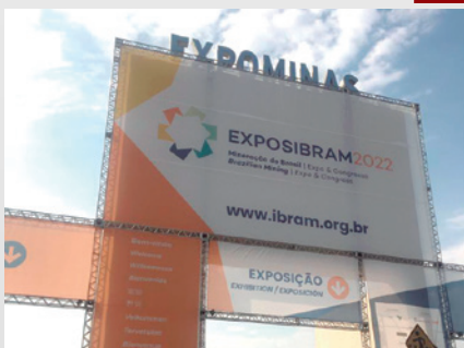
Entrada do evento em Belo Horizonte