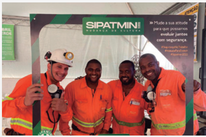
Empregados da Unidade MTL