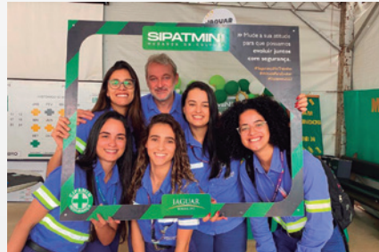
Empregados da Unidade Pilar