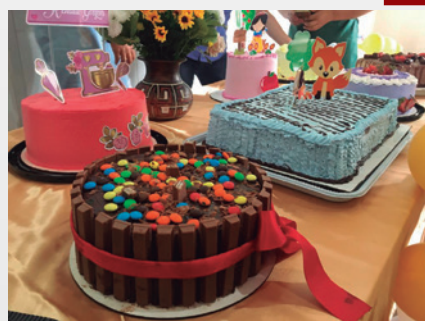
Produtos das alunas de Rancho Novo