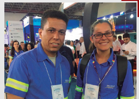
Presença de empregados da Jaguar