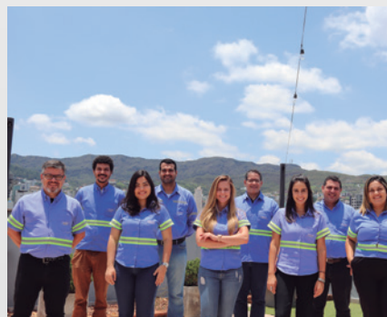
Time de Projetos de Crescimento

A equipe de Projetos de Crescimento da Jaguar está a todo vapor, envolvida em novos projetos de exploração mineral, essenciais para o crescimento orgânico da empresa, previsto no Planejamento Estratégico 2021-2024. O destaque é o projeto mineral Faina, localizado próximo à Unidade MTL, em Conceição do Pará (MG).