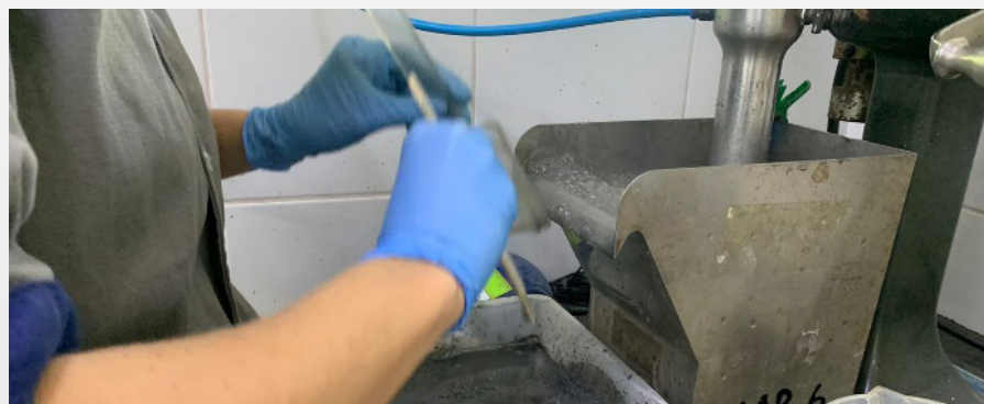
Ensaio no Cetem/RJ

Especialista de Processos, informa que para os próximos meses está prevista a execução de ensaios em escala-piloto, que serão importantes para definições de engenharia e, conseqüentemente, para a determinação do investimento necessário para a implantação do projeto de tratamento mineral. Nas próximas fases, parte dos trabalhos