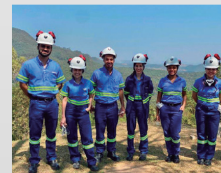
Os novos trainees

Começou uma nova turma do Talentos Diversos, o programa para trainees da Jaguar, destinado a jovens que completaram a graduação nos últimos cinco anos. Foram selecionados seis profissionais, que estão atuando nas áreas de Meio Ambiente, Projetos de Crescimento, Engenharia e Projetos, no Escritório Matriz; Planejamento e Manutenção de Planta, na Unidade MTL; Mecânica de Rochas, na Unidade Pilar;