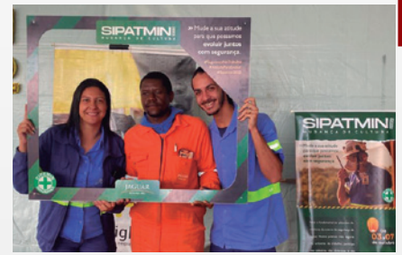
Empregados da Unidade RG