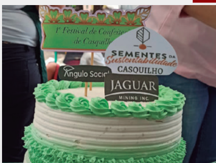
Produtos das alunas de Casquilho