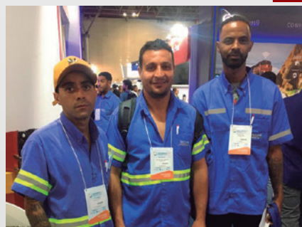
Presença de empregados da Jaguar