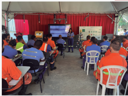
Semana de Compliance na Unidade MTL