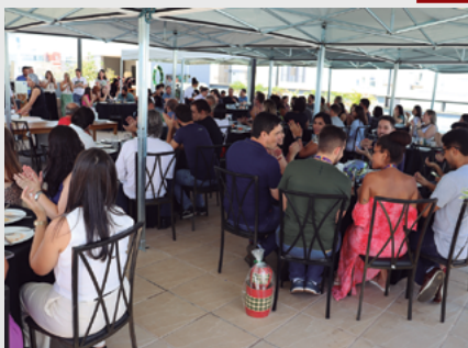
Confraternização na Matriz