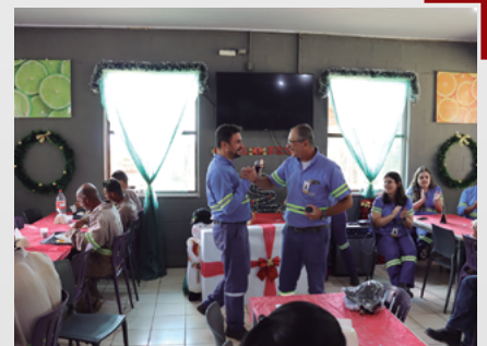
Confraternização na Unidade RG