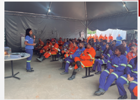
Semana de Compliance na Unidade Pilar