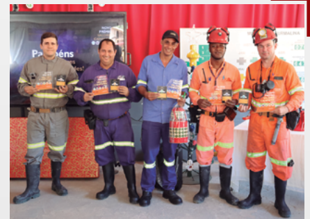
Confraternização na Unidade MTL