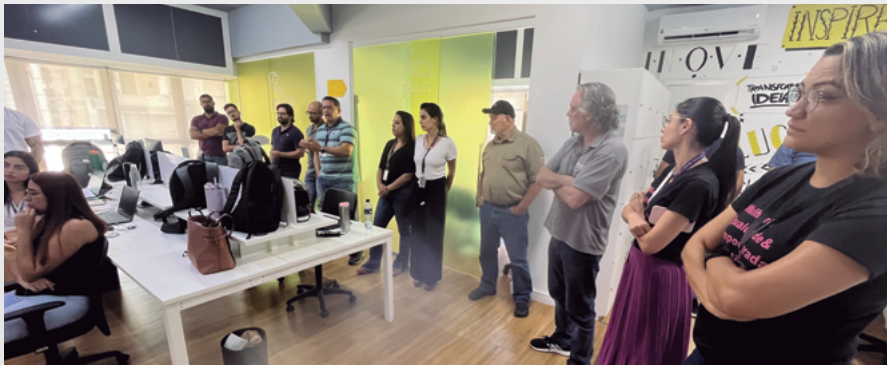
DDS realizado na Matriz

Impulsionar atitudes dos empregados relacionadas à integridade e aos valores da empresa. Com este objetivo, a Jaguar promoveu, em dezembro, a Semana de Compliance. Em todas as unidades operacionais e na Matriz (Belo Horizonte/MG) foram realizados Diálogos Diários de Segurança (DDS) especiais. Além disso, o tema “Atitude com Compliance, pratique essa ideia!” foi reforçado em uma série de comunicações internas.