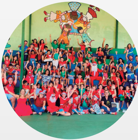
Casquilho (Conceição do Pará/MG)

O time Jaguar vivenciou o verdadeiro espírito de Natal com a participação em uma campanha realizada por meio do Programa Voluntariar. Empregados de todas as unidades tornaram-se verdadeiros papais-noéis ao apadrinharem cartinhas com pedidos