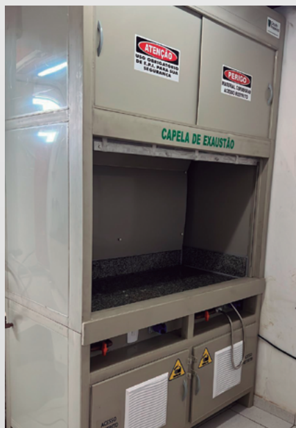
Capela de Exaustão, que evita contaminação por gases tóxicos

Qualidade e segurança são palavras-chaves no processo de implementação de análises geoquímicas no Laboratório da Unidade RG (Caeté/MG). Os equipamentos instalados têm o mais alto padrão para o melhor atendimento a todas as unidades da Jaguar.