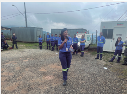
Semana de Compliance na Unidade RG