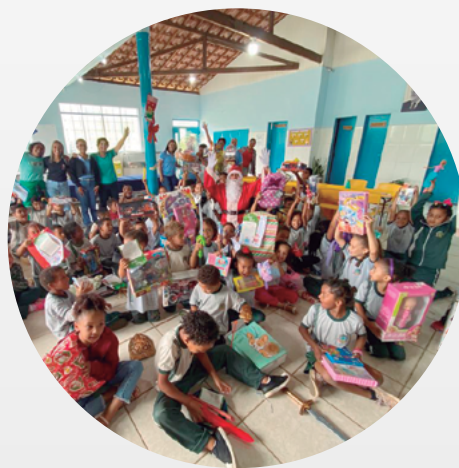
Rancho Novo (Caeté/MG)

O time Jaguar vivenciou o verdadeiro espírito de Natal com a participação em uma campanha realizada por meio do Programa Voluntariar. Empregados de todas as unidades tornaram-se verdadeiros papais-noéis ao apadrinharem cartinhas com pedidos