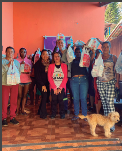
Ação em Rancho Novo

O programa é dinâmico e algumas iniciativas são definidas a partir