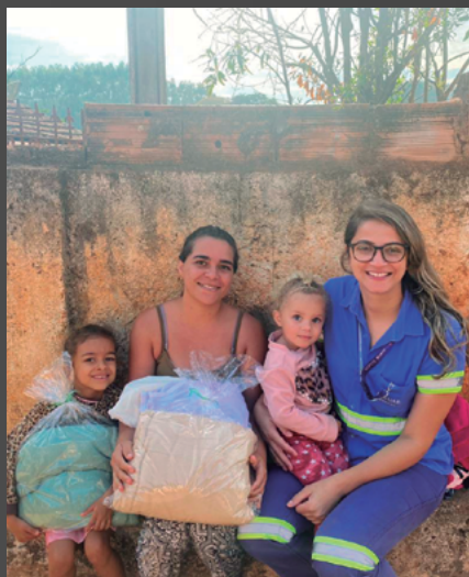
Doação em Conceição do Pará

Com um saldo bastante positivo, a Jaguar celebra o terceiro aniversário do Programa Voluntariar, que permite aos empregados próprios e terceiros, de forma voluntária, ajudarem o próximo e vivenciarem a realidade das comunidades onde a empresa atua. Muito mais do que números, o que chama a atenção é a evolução dos voluntários, cada vez mais engajados nas iniciativas.