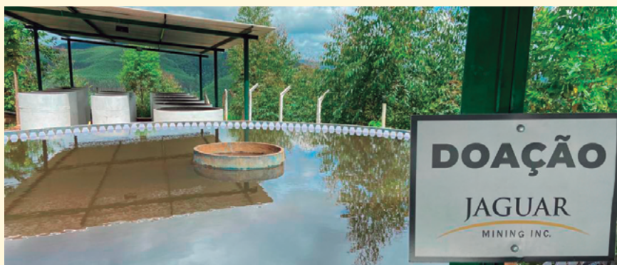
Adequações na ETA atendem demanda da comunidade

Com as adequações, serão fornecidos para a Jaguar, por