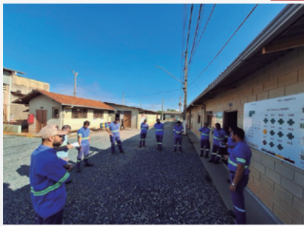
Semana de Compliance na Unidade CPA