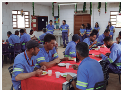
Confraternização na Unidade CPA