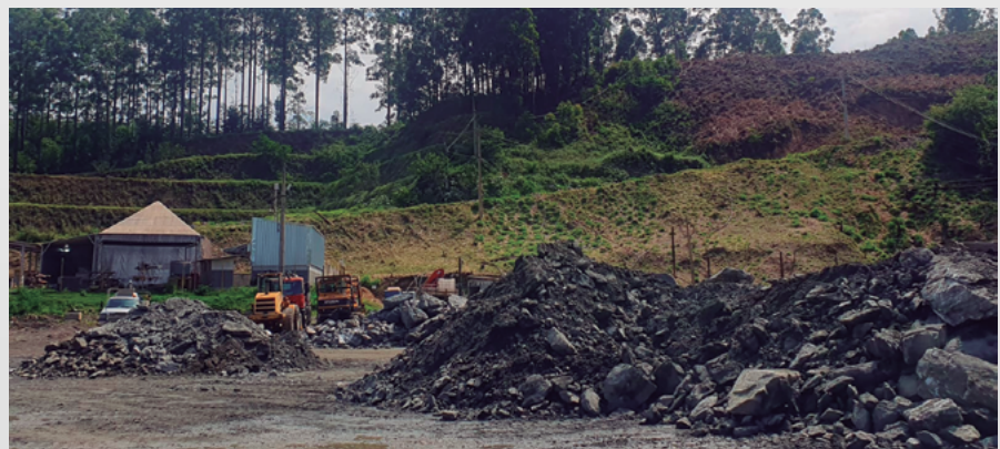
Pátio de minério da Unidade Pilar

O trabalho envolve as áreas de Serviços Técnicos, Operação de Mina e Planta Metalúrgica. Para cada minério produzido e transportado é definido um código numérico sequencial automatizado, que funciona como um código de barras. Ele é gerado