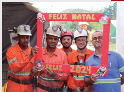
Confraternização na Unidade Pilar