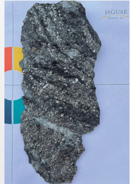
Amostra do minério extraído do corpo BA