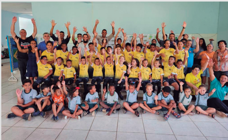
Alegria com o novo uniforme

A promoção da prática esportiva e da melhoria da qualidade de vida das gerações futuras é uma das iniciativas da Jaguar na comunidade de Rancho Novo. A empresa ofereceu uniformes completos para as aulas gratuitas de futebol às 100 crianças e adolescentes participantes do Projeto Atletas do Futuro.