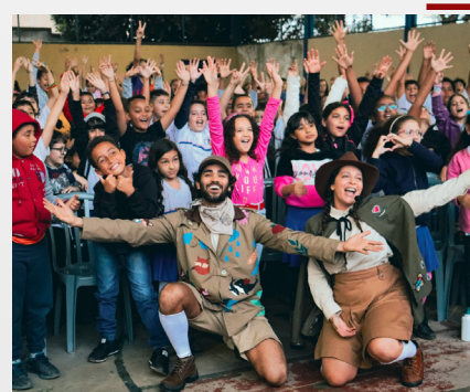
Teatro Sustentável em Barão de Cocais