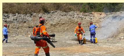
Prática de combate ao fogo na Unidade Pilar