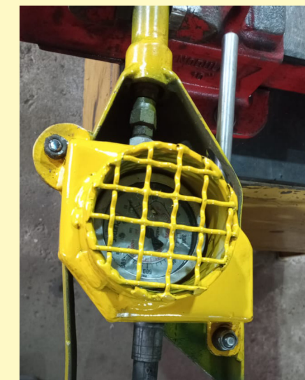
Manômetro de bomba protegido