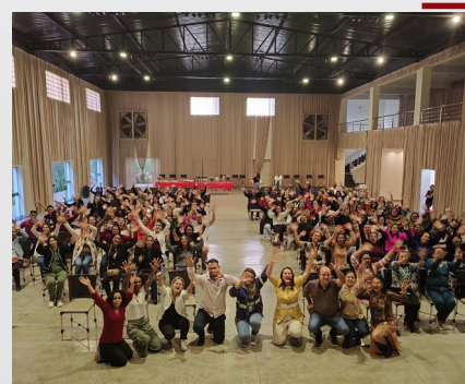
Evento do Projeto LabConexão em Conceição do Pará e Pitangui/MG