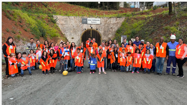
Alegria na entrada da mina