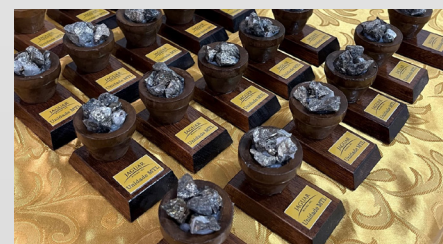
Lembrança da visita: rochas com sulfetos