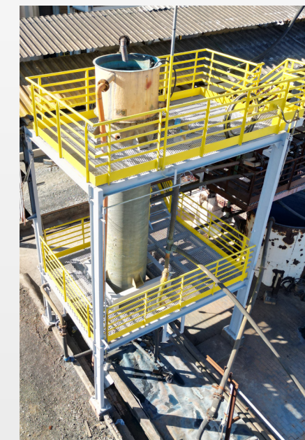
Coluna de lavagem de carvão é uma das estruturas recuperadas

Preservação dos ativos: a pintura e a proteção contra oxidação ajudam a preservar o valor dos ativos da empresa, evitando a depreciação acelerada causada pela corrosão.