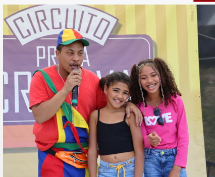
Praça Criativa/Rua de Brincar em Rancho Novo