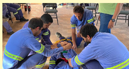
Simulação de atendimento a vítima na Unidade CPA

O Programa Quero Ser Um(a) Operador(a) dá oportunidade de crescimento aos empregados das áreas operacionais, oferecendo opções de aprendizado em diversos equipamentos e processos, por meio de processo seletivo interno e aberto a todos os que cumpram os requisitos. O empregado selecionado é treinado e assume a nova posição quando surge a vaga. O programa é realizado nas unidades da Jaguar uma vez ao ano.