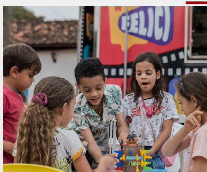
Felici - Festival de Literatura e Cinema em Brumal