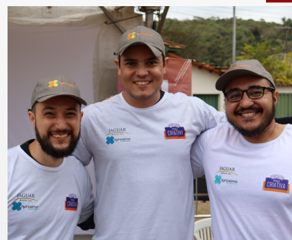
Voluntariado Engajar durante eventos nas comunidades