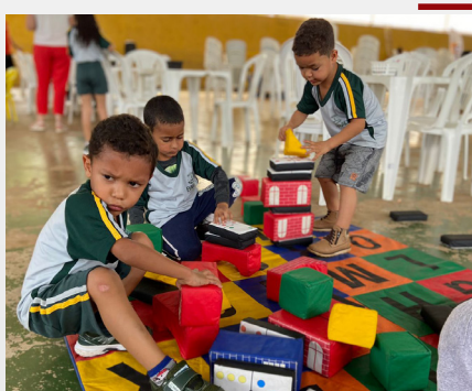
Felici - Festival de Literatura e Cinema em Barão de Cocais