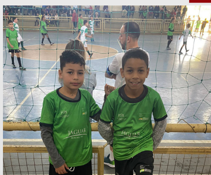
1º Festival de Futsal de Conceição do Pará