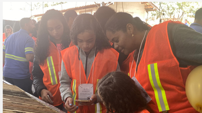
Famílias conhecem amostras de minério

O mês de julho foi marcante na Unidade MTL. Mais de 80 famílias de empregados foram conhecer a empresa, na Visita da Família. Divididas em quatro dias, elas conheceram o processo de extração e do beneficiamento de ouro e, mais que isso, a cultura e os valores da Jaguar.