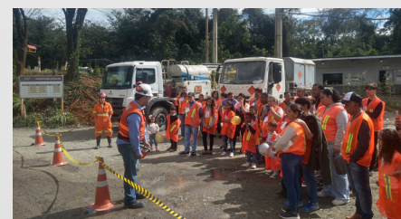
Momento de conhecer os equipamentos