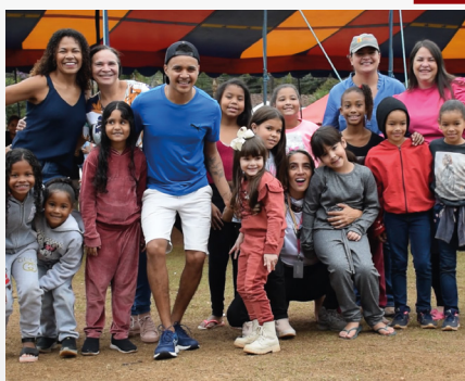
Praça Criativa/Rua de Brincar em Brumal