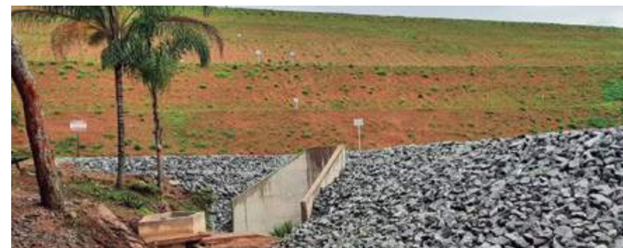
Intervenção aumentou segurança da Barragem Paciência