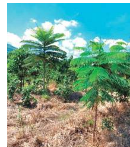
Na Mata do Cedro, as ações são contínuas desde 2017

A Jaguar começou a atuar na área em 2016. Do total das terras, 113 hectares destinaram-se à compensação, com doação de área já reflorestada ao Estado. Os 22 hectares restantes referem-se à compensação por Mata