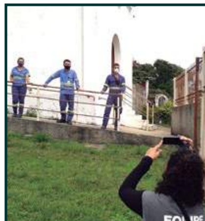
Programa Raízes do Saber Gravação da Campanha Final (Rancho Novo)