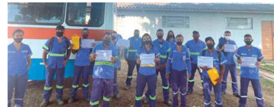
Os vencedores de MTL

Manutenção ADM, que somou 30 pontos em um total de 31 e não registrou nenhum acidente. Os ganhadores receberam um certificado de reconhecimento e um brinde pelo resultado alcançado. Está previsto para maio o início da Campanha Fórmula Ouro nas unidades de CCA/Pilar e CCA/RG.