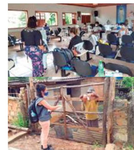
DSP nas comunidades de Brumal e Rancho Novo

No último DSP foram realizadas dinâmicas participativas com os grupos, de modo que fossem discutidas a realidade local e as principais deficiências socioambientais da região/unidade operacional. Também foram sugeridas ações e temas importantes para inserção no PEA.