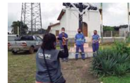
Gravação de vídeos em Brumal e Rancho Novo