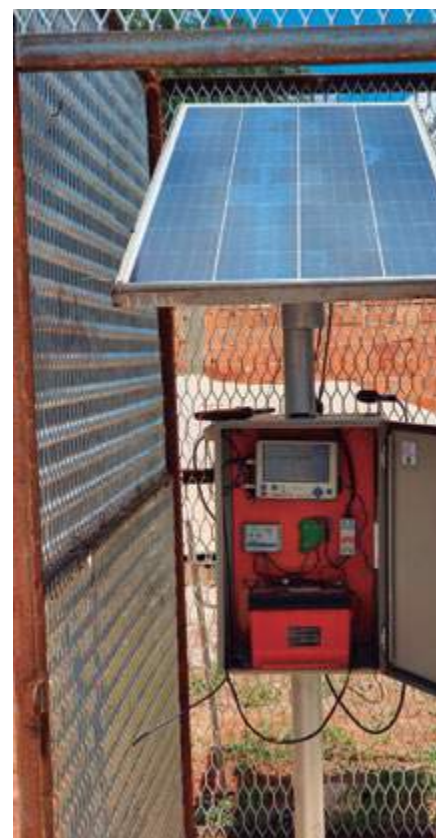
Sismógrafo opera o dia inteiro