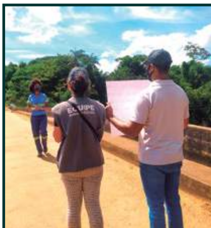
Programa Raízes do Saber Gravação da Campanha Final (Casquilho)