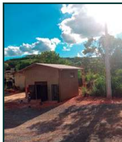
Projeto de Engenharia da Jaguar – Cabine de Medição da Cemig (MTL)