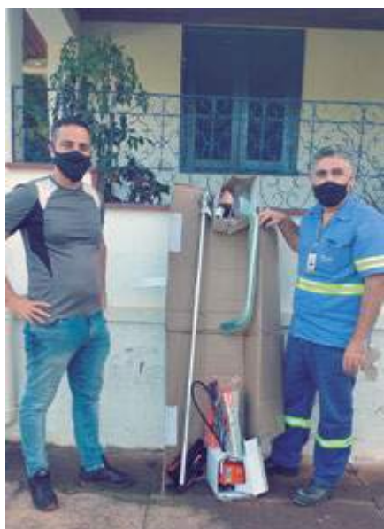
Entrega da roçadeira doada pela Jaguar a Barão de Cocais