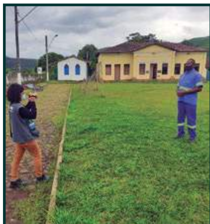
Programa Raízes do Saber Gravação da Campanha Final (Brumal)