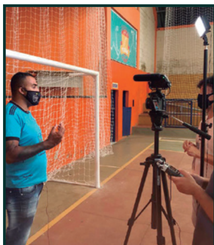
Conexão Sementes – Caminho Melhor pelo Esporte