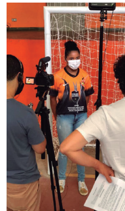
Gravação de um dos vídeos