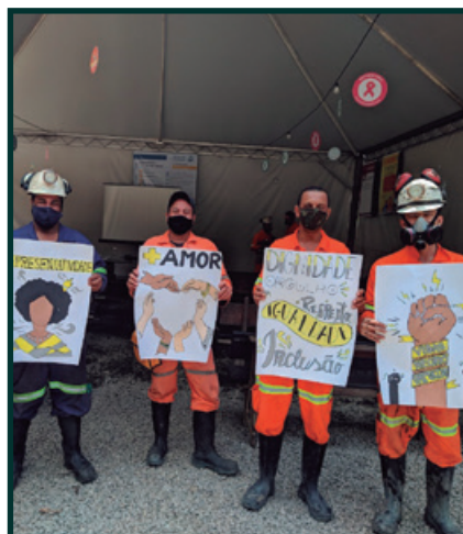
Dia da Consciência Negra – CCA/Pilar