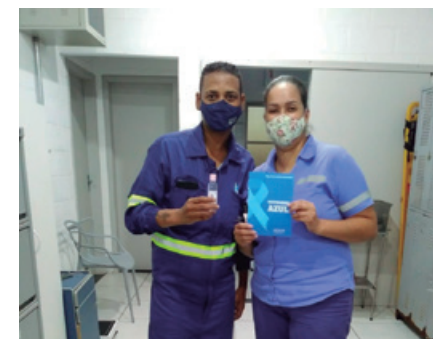
Informação e conscientização

Com a pandemia do coronavírus, neste ano os dois temas foram abordados conjuntamente, em um único dia, para evitar aglomeração e cumprir com todos os protocolos de segurança em função da pandemia. Foram feitas, nas unidades, palestras sobre as doenças, abordando de forma clara e objetiva os sintomas, fatores de risco, prevenção, tratamento e dados estatísticos, entre outras questões.