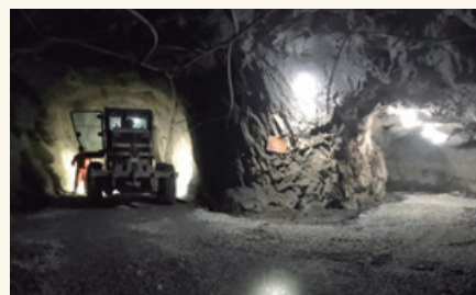
Pista em MTL