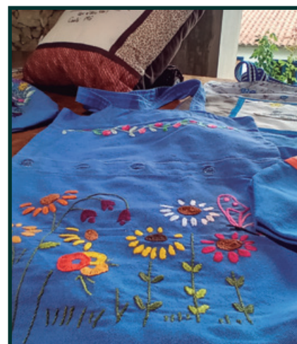
Grupo Historiarte – Bolsas feitas com uniformes doados pela Jaguar