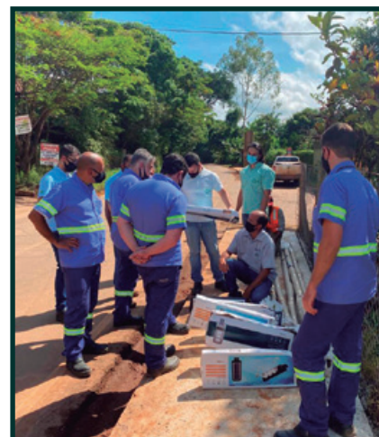
Inspeção da construção do passeio, iluminação e drenagem – Brumal