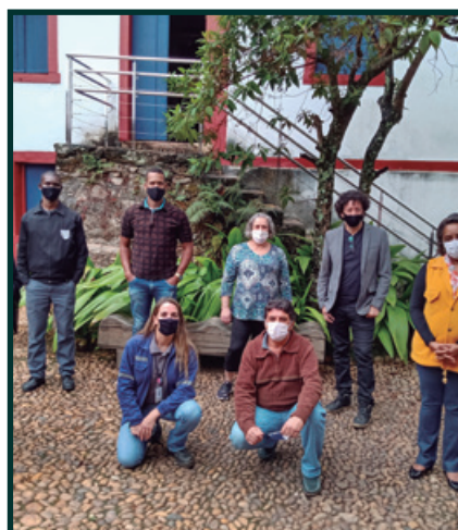
Conexão Sementes – Grupo de Bordadeiras Historiarte