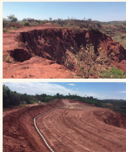
Faina antes e depois das primeiras medidas de recuperação ambiental

As ações para recuperação das áreas paralisadas são adotadas continuamente pela Jaguar em outras minas, com a adoção de medidas para manutenção e intervenções pontuais. Esse trabalho vai ao encontro do compromisso da empresa de proteger o meio ambiente e as comunidades onde atua.