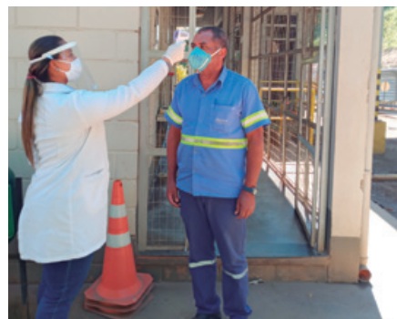
Medição de temperatura no combate à Covid

rios de Segurança (DDSs) abordando o tema.