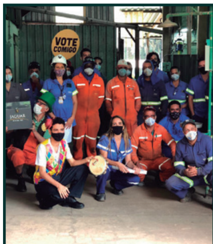
Prêmio Valores Campeões 2020 – CCA/RG