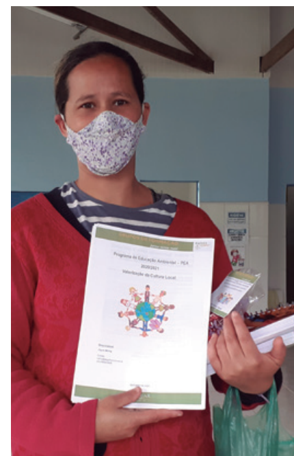
Participante do Grupo de Formação de Rancho Novo