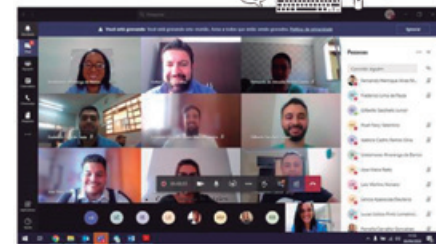
PROCESSO PRODUTIVO DA JAGUAR: DA EXTRAÇÃO DO MINÉRIO AO BENEFICIAMENTO NAS PLANTAS METALÚRGICAS

que o programa funciona de forma voluntária tanto para o instrutor que se voluntaria para ensinar quanto para quem se inscreve para participar das turmas.