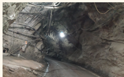
Pista na Mina Pilar

Na Mina Pilar, o fornecedor é a RCM Locação Ltda., de Barão de Cocais,